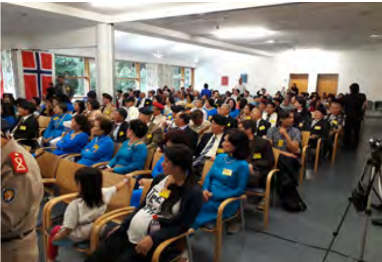
Toàn cảnh hội trường