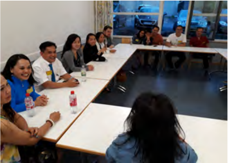
Buổi hội thảo của Thanh Thiếu Niên Đa Hiệu.